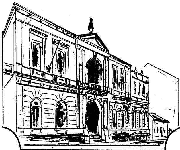
sokolovna v Písku

Družstvo hraje oblastní přebor, ale soupeřů je málo, pouze tři. Proto se softbalisté zaměřili na práci s mládeží a spolupracují se školním družstvem při ZŠ E. Beneše, které hraje baseball. Tento sport stále více získává na popularitě a našim softbalistům se zalíbil.