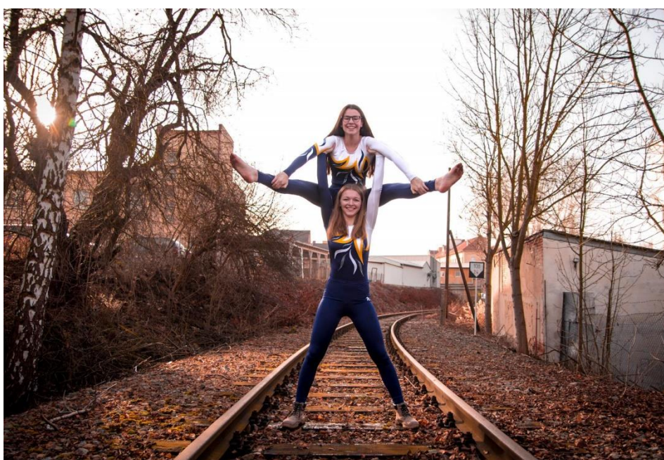
Obrázek 20: Fearless

Činnost skupiny Fearless v roce 2020 nebyla nijak zvláště rozmanitá. V lednu a únoru, probíhaly pravidelné tréninky. V lednu dívky předvedly svou novou sestavu na skautském plese, kde je diváci odměnili velkým potleskem. Únor se pak nesl hlavně ve znamení tvoření a zdokonalování nové sestavy na Přehlídce pódiových skladeb, která se měla konat v březnu v Tyršově domě v Praze. Pak bohužel přišla protiepidemická opatření, která nejen znemožnila vystupování na kulturních akcích, ale i samotný trénink.