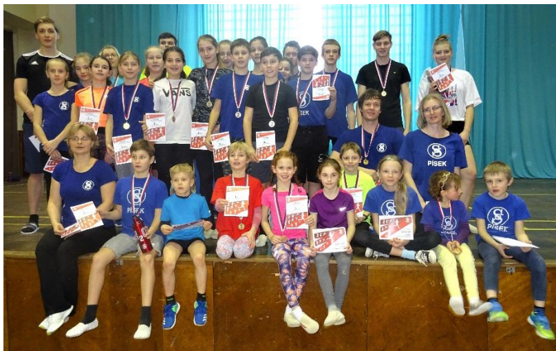
Obrázek 4: Písecká výprava na všestrannostním desetiboji

V neděli 1. března se uskutečnil 1. ročník Všestrannostního desetiboje , na kterém nemohli chybět ani píseční závodníci. Do Českých Budějovic, které závod pořádaly, se vypravilo 35 našich členů, kteří si vedli velice dobře. Závod se skládal z deseti různých disciplín, které měly prověřit všestrannost závodníka. Všichni si tedy vyzkoušeli skok do dálky, přelézání tyčky, šplh, člunkový běh, překážkovou dráhu, vznosy, shyby, dřepy, přeskoky přes švihadlo a hod medicinbalem. Písecká výprava si domů přivezla dohromady 19 medailí (7 zlatých, 6 stříbrných, 6 bronzových). Nejlepšími závodníky, kteří ve svých kategoriích vybojovali nejvyšší příčku, byli: