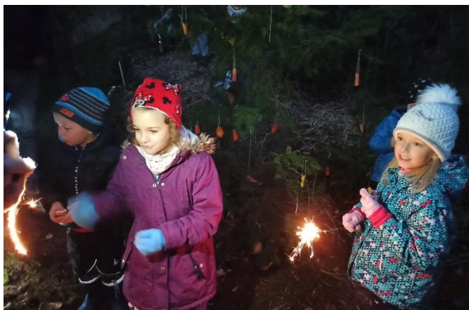
Obrázek 18 - Oddělení rodičů a dětí u vánočního stromku

Letošní novinkou byla předvánoční výprava do lesa, kde děti zdobily vánoční stromek pro lesní zvěř . Do této akce se zapojila dvě oddělení. V úterý 15. prosince se skupinka rodičů a dětí sešla u Třech rybníků, ozdobili stromek jablíčky, mrkví, lojovými koulemi a za rozzářených prskavek si společně zazpívali koledy. V neděli 20. prosince se pak po skupinkách vydalo do lesa u Třech rybníků oddělení gymnastiky. Každá skupinka si ozdobila svůj stromeček, proběhlo předání drobných dárečků za zvuku koled, ochutnávka cukroví a s touto vánoční náladou se poté skupinky rozešly zpět domů.