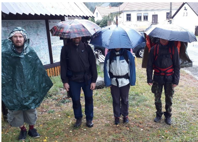
Obrázek 13: Účastníci podzimního vandru