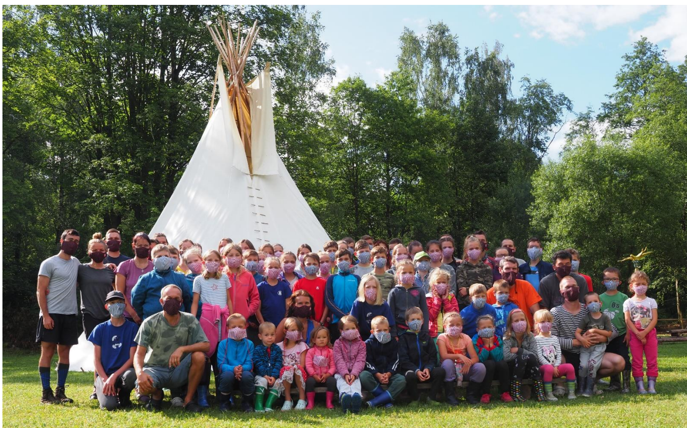
Obrázek 6: Letní tábor v Záblatí

bylo na programu i vystoupení párové akrobacie. Krásným závěrem celého večera byl kvíz pro děti následovaný bojovkou, během které účastníci hledali svítící tyčinky rozházené po všech koutech sokolovny. Dalším úkolem pak bylo seskládat sokolský znak, jenž byl tématem letošního ročníku této akce. Po tomto závěru si už odvážnější Sokoláci nachystali svá místa na spaní, aby si po pohádce na dobrou noc mohli užít přespání v prostorách, kam obvykle chodí cvičit.