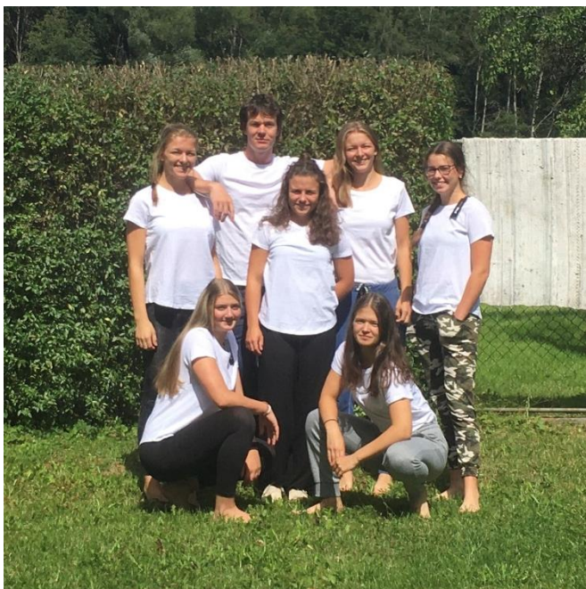
Obrázek 10: Soustředění dívek a žen

stmelovací a vzdělávací hry, při nichž si všech devět dětí osvojilo nejen osobnosti, ale i všechna důležitá data a události, která se Sokolem souvisí.