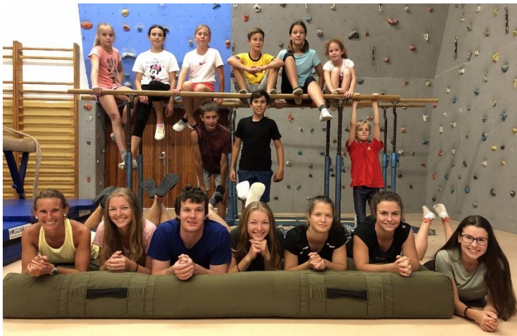
Obrázek 9: Soustředění dětí z oddělení gymnastiky