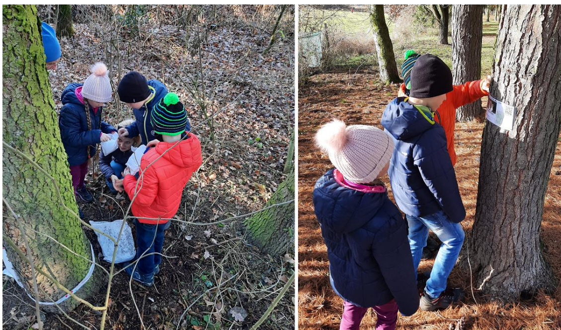
Obrázek 23: Vánoční KorOrienták #4

S příchodem vánočních svátků, jsme přišli s dalším KorOrientákem. Šlo o 10 stanovišť, na kterých byl vždy obrázek z nějaké vánoční pohádky, dále pak kvízová otázka, která se pohádky týkala a 3 možné odpovědi. Ke každé odpovědi pak patřila jedna nápověda k nalezení sokolského pokladu s vánočním dárkem, takže po správném zodpovězení dostatečného množství otázek bylo možné poklad najít. Na vánoční KorOrienták se museli zájemci přihlásit přes náš web, do emailu pak dostali zašifrovaný odkaz se startovním místem. Na akci se přihlásilo přes 60 lidí, a to nejen z Písku. Krátký čas bylo u pokladu možné vyluštit ještě další hádanku a nalézt bonusový dárek. To se povedlo rodině Cibulkových, která kvůli tomuto KorOrientáku přijela až z Tábora. Původně měla být vánoční trasa aktivní jen přes vánoční prázdniny, nakonec však pro oblibu vydržela až do konce ledna.