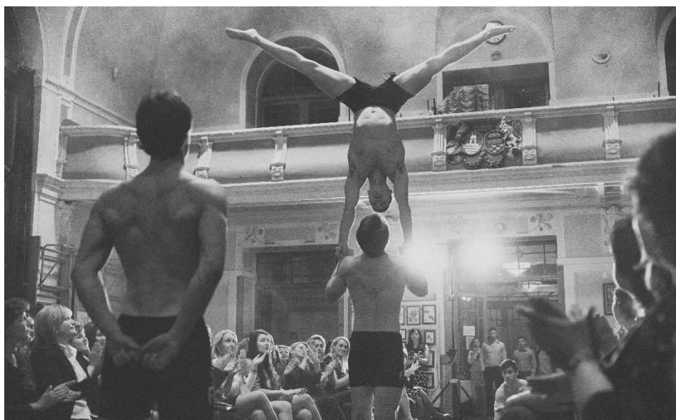
Obrázek 19: Five Fellas

Letošní novinkou byla předvánoční výprava do lesa, kde děti zdobily vánoční stromek pro lesní zvěř . Do této akce se zapojila dvě oddělení. V úterý 15. prosince se skupinka rodičů a dětí sešla u Třech rybníků, ozdobili stromek jablíčky, mrkví, lojovými koulemi a za rozzářených prskavek si společně zazpívali koledy. V neděli 20. prosince se pak po skupinkách vydalo do lesa u Třech rybníků oddělení gymnastiky. Každá skupinka si ozdobila svůj stromeček, proběhlo předání drobných dárečků za zvuku koled, ochutnávka cukroví a s touto vánoční náladou se poté skupinky rozešly zpět domů.