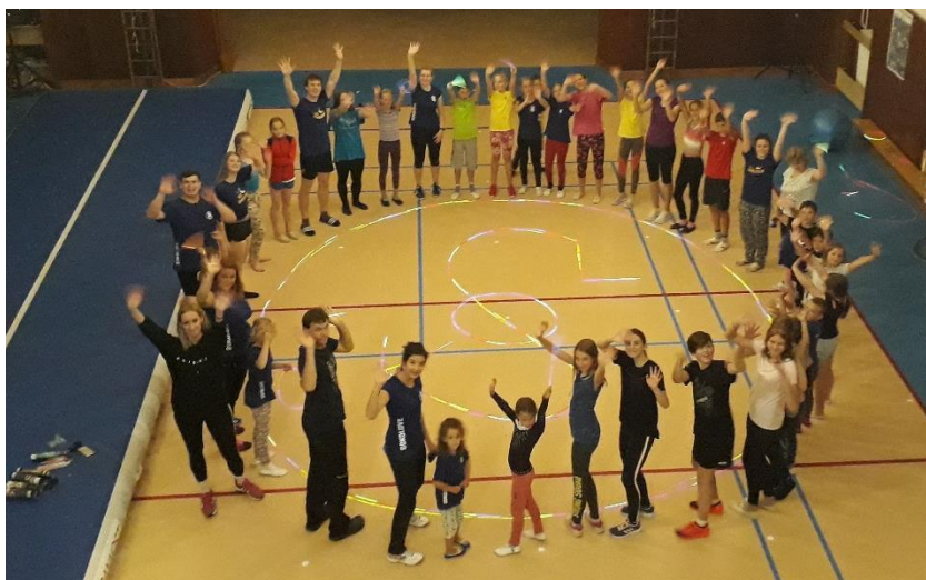
Obrázek 5: Účastníci se sokolským znakem ze svítících tyčinek