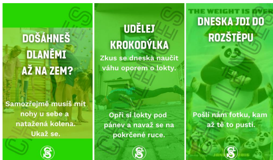
Obrázek 15: Sokolské výzvy

Krátce po říjnovém vyhlášení nouzového stavu začal Marek Matoška zveřejňovat na našich sociálních sítích sokolské výzvy pro všechny Sokoly a nadšence do pohybu. Každý den byl věnován jinému úkolu povětšinou fyzického rázu. Udělat za den 100 kliků, vyskákat všechny schody po jedné noze nebo se dotknout dlaněmi země. Zveřejněny byly i výzvy atraktivnější – posadit se do futer nebo se vyfotit hlavou dolů. Objevil se také úkol výtvarného rázu – nakreslit sokolský znak.