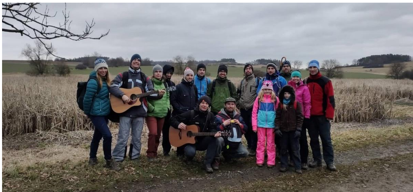
Obrázek 1: Hrejkovická 20