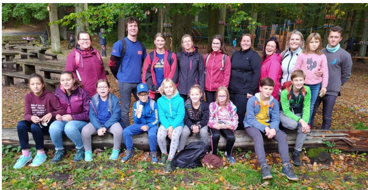
Obrázek 21: Účastníci výletu s názvem Dobytí Ameriky

I přes to, že do realizace projektu velmi negativně zasáhla pandemie, podařilo se jej úspěšně spustit a pevně věříme, že jej v následujících letech budeme ještě úspěšněji rozvíjet. Dále najdete přehled akcí, které se v rámci Centra OV povedlo zorganizovat, situaci navzdory.