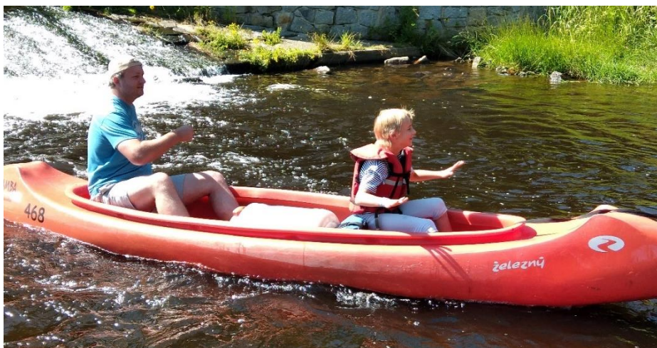
Obrázek 7: Splouvání Otavy rodičů a dětí

Součástí pestrého programu byla výuka tábornických dovedností, mezi něž patří například vázání uzlů, stavba přístřešků, zapalování ohňů, první pomoc či čtení v mapě. V druhém týdnu se pak konaly různé soutěže a závody - Tarzanův běh, orientační běh, všestrannostní závod, dřevorubecký závod a jiné. Dále se táborníci mohli zúčastnit stezky odvahy nebo jednodenního či dvoudenního výletu. Ačkoli jsme dlouho byli na vážkách, zda tábor proběhne a za jakých podmínek, nakonec si všichni účastníci užili šestnáct dní plných zábavy.