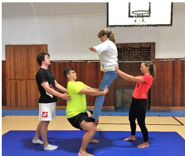
Obrázek 12: Seminář párové akrobacie

Od čtvrtka 24. září do úterý 29. září probíhala akce Sokol spolu v pohybu , během které byly cvičební hodiny jednotlivých oddělení přístupné i pro veřejnost. Tématem letošního ročníku byly tradiční české hry. Děti si tedy vyzkoušely hry, které v jejich věku hráli jejich rodiče nebo cvičitelé. Hrála se například školka s míčem, Cukr káva limonáda, skákal se panák a ti nejmladší si zahráli Na rybáře nebo Čáp ztratil čepičku. Spoustu her děti znaly, ale některé si vyzkoušely poprvé a společně s vedoucími si to náramně užili. Každý účastník si pak domů odnesl drobný dáreček.