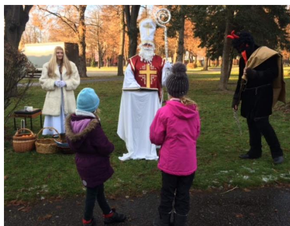
Obrázek 22: Mikuláš, čert a anděl mimo sokolovnu

Kvůli uzavřené sokolovně nemohl v tomto roce Mikuláš navštívit naše cvičence při cvičení, a tak se Odbor všestrannosti rozhodl, že tentokrát Mikuláše navštíví sami cvičenci. V sobotu 5. prosince jsme proto uspořádali záchrannou výpravu za Mikulášem. Zájemci mohli trasu procházet od 9:30 až do 17:30. Za pěkného slunečného počasí se na ni vydalo skoro 150 dětí, které byly většinou doprovázeny rodiči či známými. Děti měly projít trasu, na které bylo celkem 5 úkolů. Jejich cílem bylo najít sokolského Mikuláše a získat pro něj lék proti viru „Koronáči“. Mezi úkoly, jež děti plnily, patřilo například vymyslet básničku pro Mikuláše, rozluštit radu od vševědoucího stromu či získat od