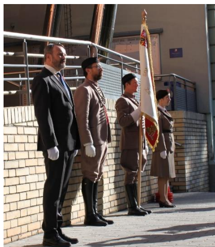
Obrázek 14: Krojovaní Sokolové v ČB

Od roku 2019 oslavují Sokolové 8. října Památný den sokolstva . V tomto dni si připomínáme všechny Sokoly, kteří přinesli tu nejvyšší oběť v boji za svobodu, demokracii a nezávislost. Ve čtvrtek 8. října odjeli nejprve tři píseckí krojovaní Sokolové do Českých Budějovic, kde na krajském úřadě společně s hejtmankou Jihočeského kraje a starostu Jihočeské župy dělali čestnou sokolskou stráž při vyvěšování vlajky ČOS. V podvečer jsme pak uspořádali lampiónový průvod v čele s našimi třemi krojovanými Sokoly s prapory. Účast byla veliká (více než 100 lidí), takže se vzhledem k hygienickým opatřením musel průvod rozdělit na několik skupinek, které vycházely postupně za sebou. Průvod začal v Palackého sadech, pokračoval k poště, pak na Florián, přes Velké náměstí ke starému mostu, a nakonec zpět do parku k sokolovně.